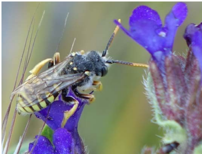
Die Feldwespen-Biene, Nomada goodeniana (Bild) hat der Fotograf beim Zählen der Ochsenzungen-Sandbienen am Windsberg bei Freinhausen auf einer Ochsenzunge entdeckt.

Jetzt hört man den Kuckuck, der seine Eier in fremde Nester legt, an vielen Stellen rufen. Auch im Reich der Wildbienen gibt es "Kuckucke". Sie heißen Nomada oder deutsch Wespenbienen. So wie das Kuckucksweibchen z. B. das Nest des Hausrotschwanzes belauert, beobachtet die Wespenbiene die Niströhre einer Sandbiene, z. B. der Dusterbiene. Hat sich die Dusterbiene entfernt, um Nektar und Pollen für ihre Brut zu holen, legt die Wespenbiene schnell ein bis drei Eier zu den Eiern der "Wirtsbiene". Da die Wespenbienen-Larven früher schlüpfen als die Larven der Sandbiene, fressen sie den gesammelten Pollenkuchen und oft auch noch Eier und Larven der "Wirtin" auf. So sorgt die Wespenbiene für ihre Nachkommen, ohne sich der Mühe der Futterbeschaffung zu unterziehen. Blüten befliegt sie nur, um sich mit Nektar, ihrem "Flugbenzin" zu versorgen. Einige Wespenbienen sind an ihrem schwarz-gelben Kleid zu erkennen. Um sich vor Fressfeinden zu schützen, geben sie sich das Aussehen von Wespen, die andere Tiere gefährlich stechen könnten.