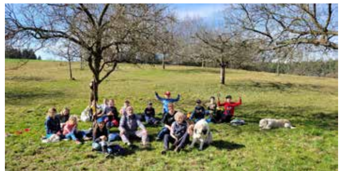
Bei der Frühlingswanderung 2025 entdeckte zum ersten Mal eine bunte Truppe an Kindern den Frühling. In diesem Jahr wird die Veranstaltung wiederholt.

Die Teilnehmerzahl ist auf 12 Kinder begrenzt, eine Anmeldung ist daher erforderlich. Anmelden können sich Interessierte bis spätestens 19. März per E-Mail bei Margret Hilbig unter margret.hilbig@web.de . Die Teilnahme kostet 3 Euro für Tee und Gebäck. Mitzubringen sind feste, wetterfeste Kleidung, die schmutzig werden darf, eine Sitzunterlage und etwas zu trinken. Bei Regen muss die Veranstaltung leider entfallen.