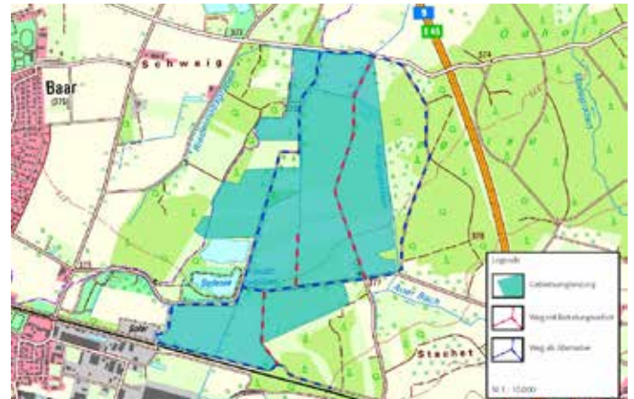
Karte 1. Karte der Feldvogelkulisse „Am Heideweiher“ mit zur Brutzeit gesperrten Wegen in Rot und geöffneten Wegen in Blau.

Mit etwas Rücksicht und konsequenter Einhaltung der Regeln können die typischen Arten der Offenlandschaft erhalten bleiben – damit auch zukünftige Generationen ihren Gesang und ihre eindrucksvollen Balzflüge erleben können.