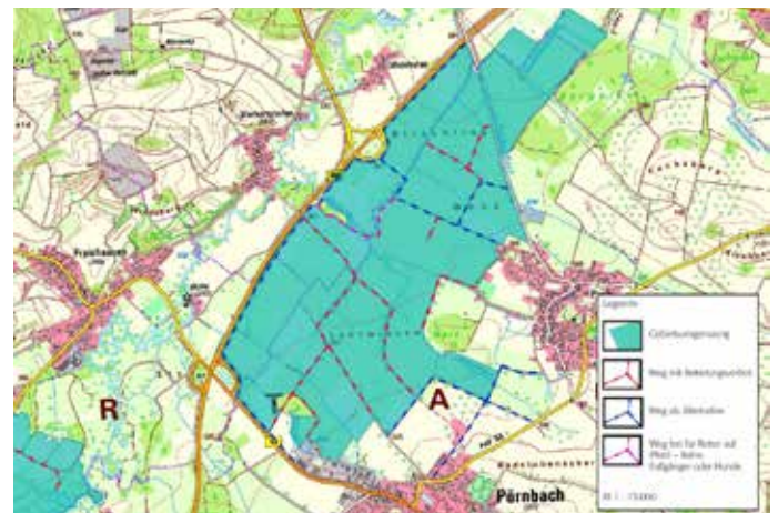
Karte 2. Wiesenbrüterkulisse Pucher Moos mit zur Brutzeit gesperrten Wegen in Rot und geöffneten Wegen in Blau.