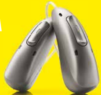
Phonak Audeo™ R Infinio